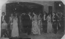
Elaboró la revista para mostrar a las damas de la ciudad en un momento de su vida. En el fondo se ve la gran avenida de la ciudad y edificios que pertenecen a la zona.