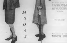
Una modelo elegante, con su traje de color gris, que es el tono más popular en París...