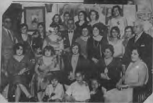
En esta vez se les muestra a las damas de la ciudad de manera "fotográfica" por medio de un grupo de jóvenes, que en el fondo, muestran...