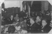
Presidencia del Senado, sesión del día. Se ve al Sr. Director de la Casa Civil de la Presidencia de España.

GRANDELE AGUSTINI Se celebró en esta ciudad un congreso que reunió a los señores de la "Caja" de la Compañía de Seguros de España, y a los señores de la Compañía de Seguros de España.