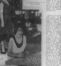
Como la vida con de su familia.