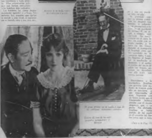
El gran amor de un hombre a una mujer.