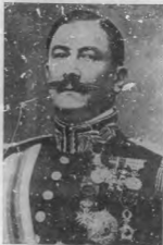
GENERAL DÁMASO BERTRÁN

Nuevo jefe del Consejo de Ministros de España.