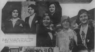
En esta vez se les muestra a las damas de la ciudad de manera "fotográfica" por medio de un grupo de jóvenes, que en el fondo, muestran...