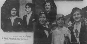
En un momento de la recepción de la Escuela Normal de Maunabo, en la noche del viernes pasado, en el Hotel "El Estrella".